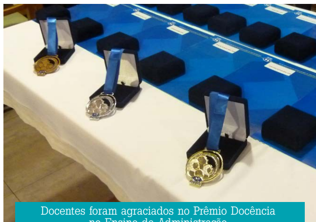
Docentes foram agraciados no Prêmio Docência no Ensino de Administração